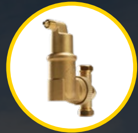
SPIROVENT® RV2 MICROBELLENLUCHTAFSCHEIDER