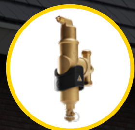
SPIROCOMBI® MB3 LUCHT- EN VUILAFSCHEIDER