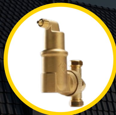
SPIROVENT® RV2 MICROBELLENLUCHTAFSCHEIDER