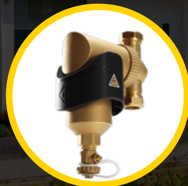
SPIROTRAP® MB3 MAGNETISCHE VUILAFSCHEIDER